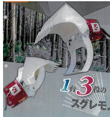
ウルトラザウスロボ